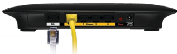
Podłączanie kabla linii DSL