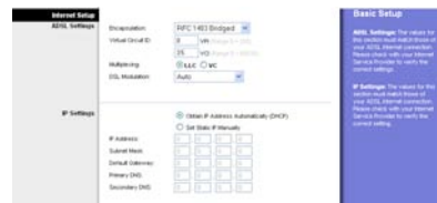
Static IP Address