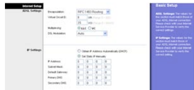
RFC 1483 Routed