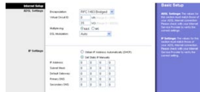
Dynamic IP Address