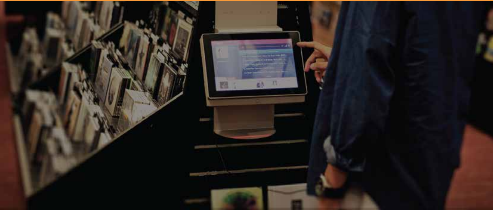
Obsługa powyżej 200 urządzeń