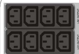
8x wyjścia IEC (programowalne)