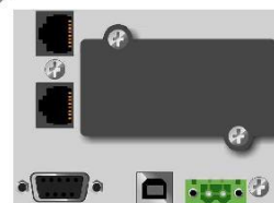
RJ11/RJ45, RS232. dry-out, Slot kart, USB, EPO